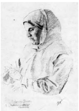
Бабуля, першы настаўнік батанікі астранома. Малюнак выкананы дзядулем Ціхава.

У 1895 г. будучы стваральнік астрабіялогіі зацікавіўся батанікай і прачытаў некалькі кніг, у тым ліку